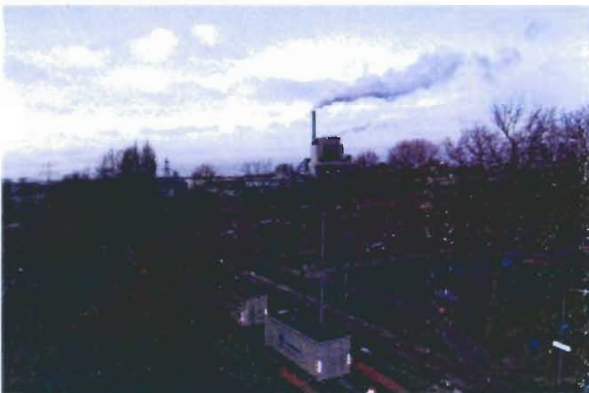
Een deel van het Park West, nu Westerpark geheten, gezien vanuit het appartementencomplex Het Zwin aan de westrand van het Waterkwartier. Op de achtergrond het industriegebied aan het Maas-Waalkanaal.

Het Gemeenschapshuis van het Waterkwartier werd in 1963 gefinancierd en gebouwd door de wijkbewoners. Op termijn wordt het nu gesloopt en ter plaatse vervangen door een 'voorzieningshart' waar ook de Aquamarijnschool dele van uit zal maken. Verder ligt tussen het industriegebied en de bebouwing van het Waterkwartier het enkele jaren geleden aangelegde Park West, inmiddels omgedoopt tot Westerpark. Tot voor kort lagen hier diverse sportvelden. Nog dit jaar wordt het gebied heringericht. En dan is er natuurlijk nog de nieuwe stadsbrug die pal ten westen van het Waterkwartier op de zuidelijke Waaloever aan zal landen. Dat deze brug de nodige gevolgen zal hebben voor de verkeersstromen in de wijk is duidelijk. Hoe groot die gevolgen zullen zijn, daarover verschillen op dit moment de meningen.