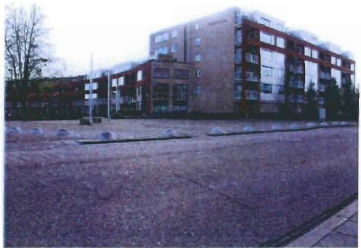
De flat Fortuna, op de plek waar vroeger de Theresiakerk stond. De lagere appartementsgebouwen links op de foto hebben de plaats ingenomen van het klooster en de pastorie.