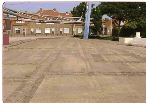
Het Maasplein voor...

De aanleiding voor de opknopbeurt was een bezoek van het college van burgemeester & wethouders. Daar wezen bewoners de bestuurders al op het 'saaie' plein met een slechte ondergrond. Met later nog een enquête en een informatieavond was het duidelijk wat de buurt met het plein wilde. Daar is de gemeente mee aan de slag gegaan. Het resultaat mag er zijn. Daarnaast wordt er nog een bord geplaatst waarop tekst en uitleg wordt gegeven van het bijzondere Romeinse verleden van deze plaats in het Waterkwartier.