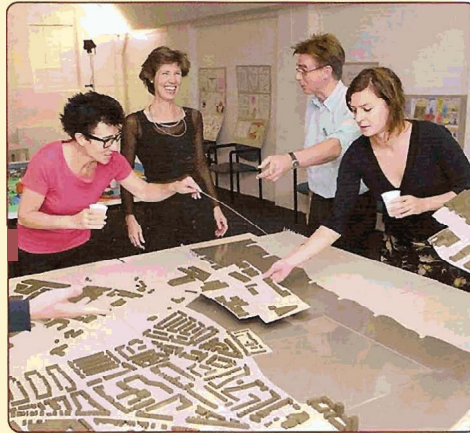
Zelf bouwen aan het nieuwe Waalfront tijdens de open inloop