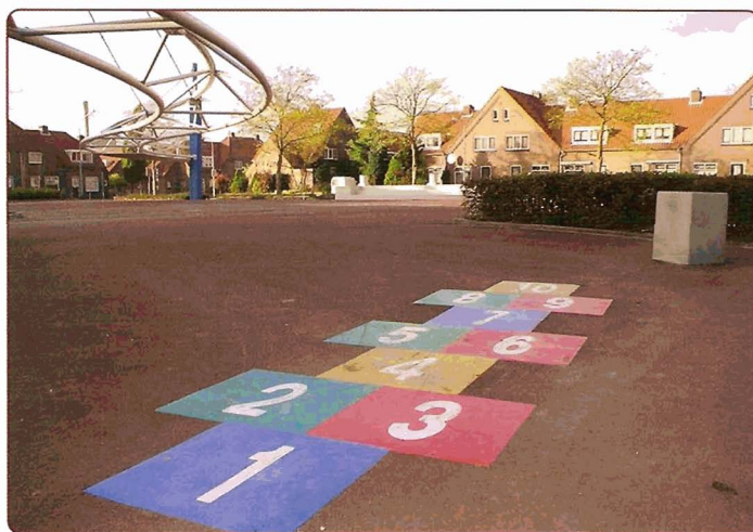
...en na de opknopbeurt